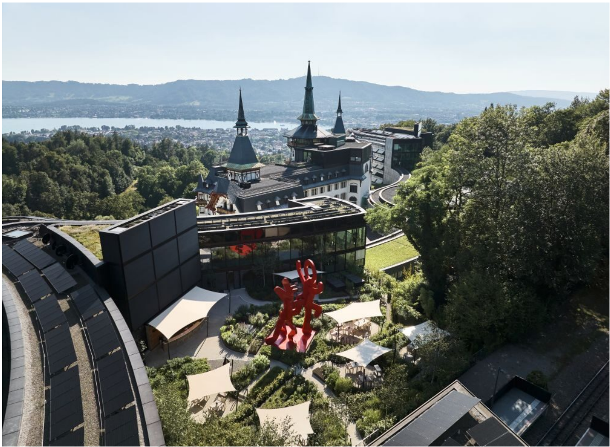
Photovoltaikanlage auf den Dächern des Dolder Grand