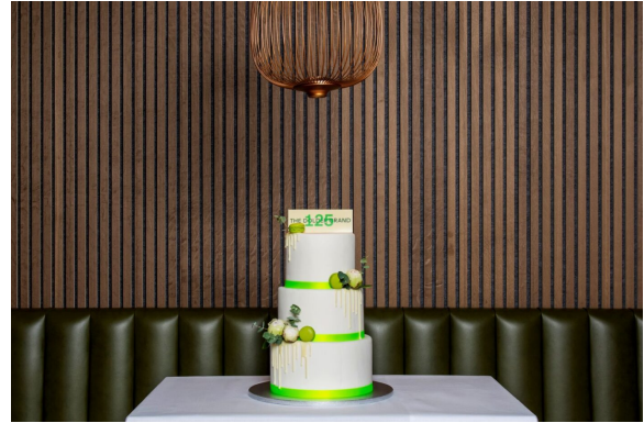
Geburtstagskuchen für das Dolder Grand

Genau am 10. Mai 2024 wurde das Dolder Grand 125 Jahre alt. Da haben wir es uns natürlich nicht entgehen lassen, mit der gesamten Belegschaft auf den historischen Tag anzustossen und das Dolder Grand hochleben zu lassen. Die hauseigene Patisserie hat zur Feier des Tages ebenfalls eine wunderschöne Torte kreiert – sie schmeckte fantastisch!