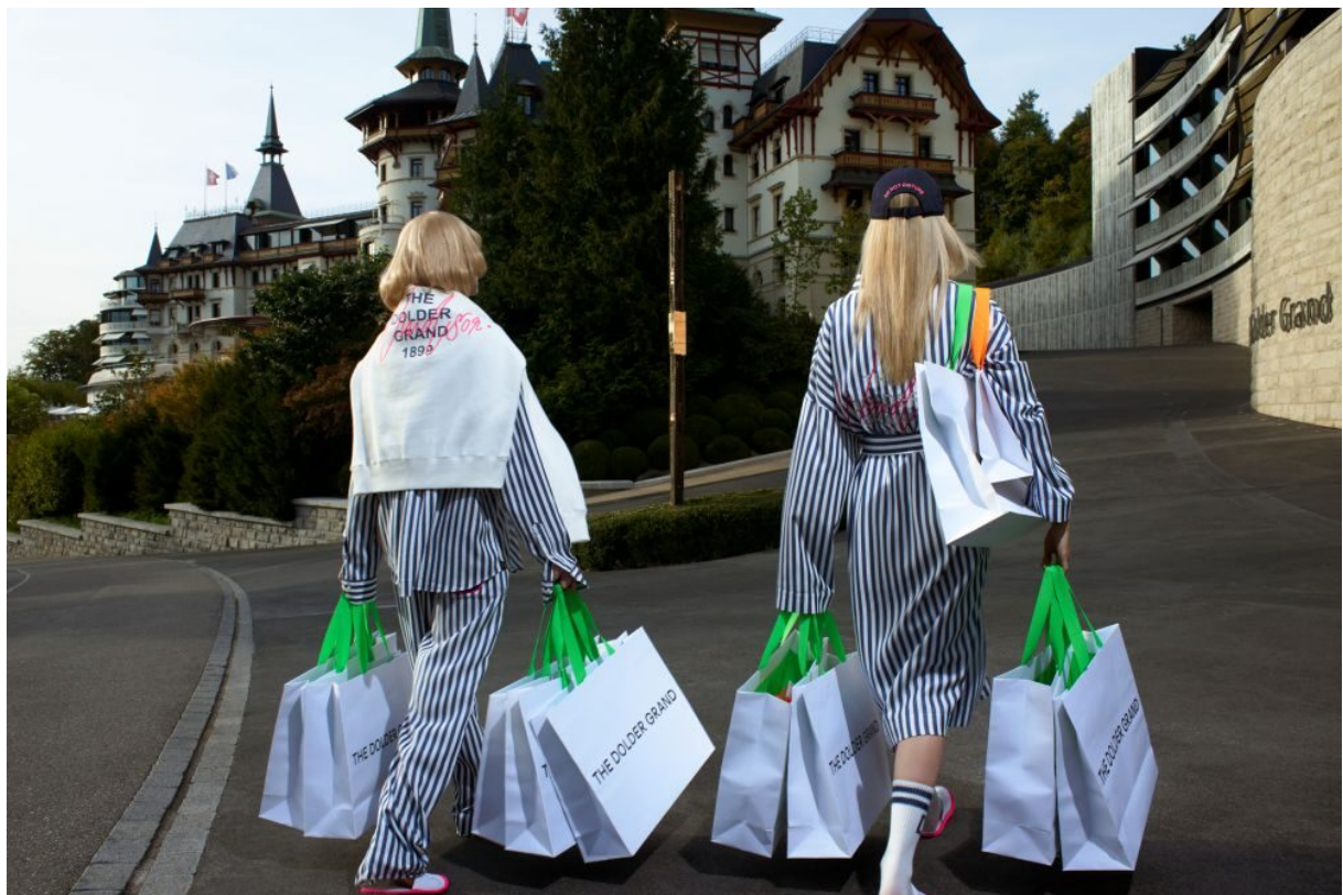
Capsule-Collection windsor. X The Dolder Grand

Im Mai 2024 gab unser Marketing-Team den offiziellen Startschuss für die Jubiläumskampagne. Ein eigens geschnürtes 125-Jahre-Jubiläumspackage bot unseren Gästen besondere Momente im Dolder Grand, während gebrandete Jubiläumverpackungen, Kugelschreiber und Welcome-Amenities subtile, aber stilvolle Akzente im Hotel setzten. Doch es war vor allem die Out-of-Home-Kampagne, die für Aufsehen sorgte. Mit bewusster Zurückhaltung und ohne Logo tauchten markante schwarz-weiße Werbeflächen an verschiedenen Orten auf. Die Botschaften? ROCKSTARS STAY HERE. ROYALS STAY HERE. HOLLYWOOD STARS STAY HERE. Klare Statements, die neugierig machten. Nur ein QR-Code verriet, wer hinter der Kampagne steckte. Wer ihn scannte, wurde direkt auf die Website des Dolder Grand geleitet und erhielt zugleich einen spannenden Einblick in das digitale Gästebuch. An der Zürcher Bahnhofstrasse, am Flughafen Zürich oder in den Strassen Londons – die Kampagne war unübersehbar.