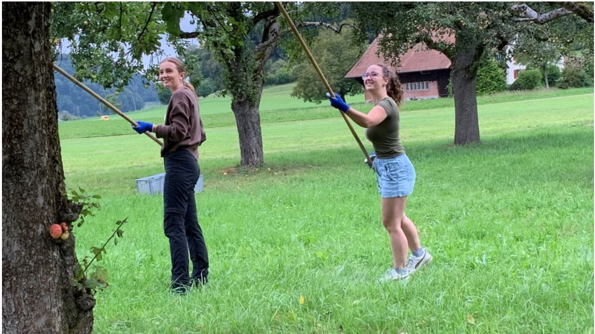
Corporate Volunteering in der Arche Therapie Bülach

Weihnachten ist die Zeit für Reflexion und Nächstenliebe. Seit drei Jahren verzichten wir auf gedruckte Weihnachtskarten und versenden unsere Festtagsgrüsse digital. Die dabei eingesparten Kosten kommen der Winterhilfe Schweiz zugute, welche benachteiligten Kindern Zugang zu Freizeitkursen ermöglicht.