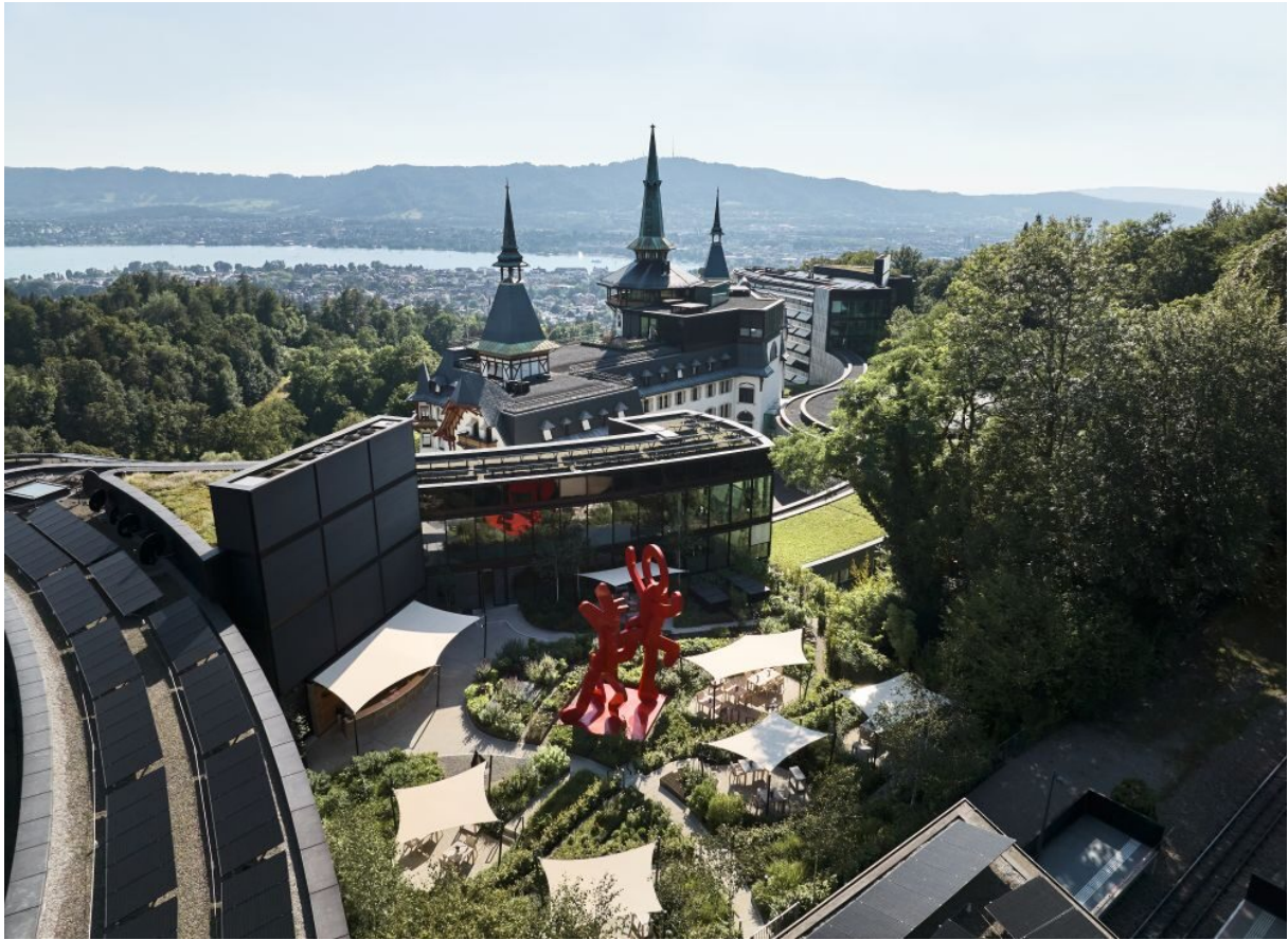
Photovoltaikanlage auf den Dächern des Dolder Grand