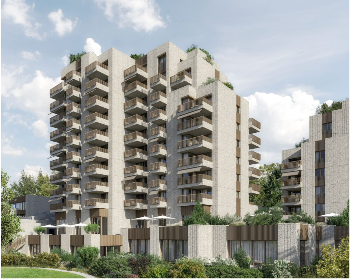
Rendering des neuen Dolder Waldhaus vom Architekturbüro Fanzun AG