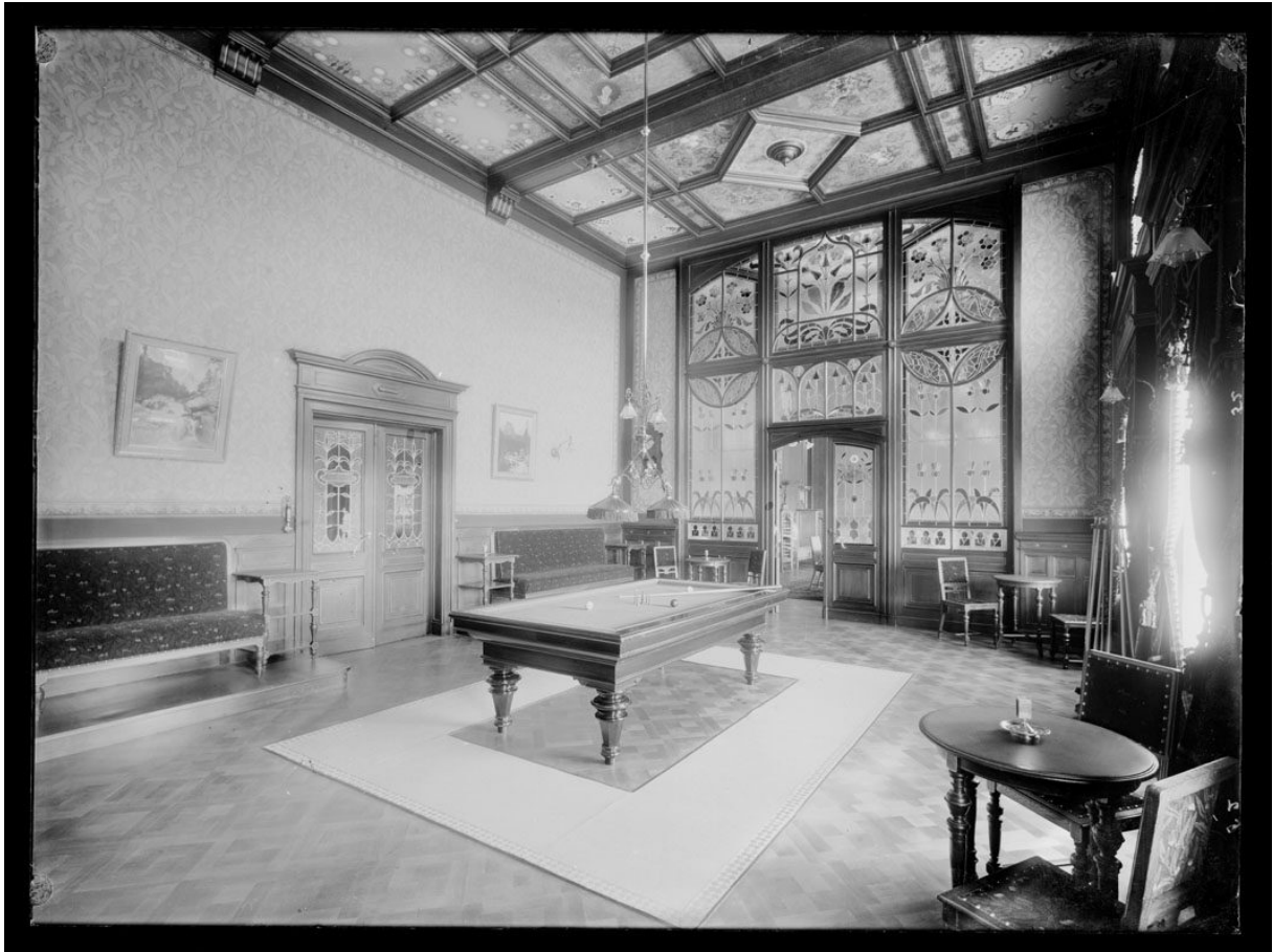
Ehemaliges Spielzimmer im Dolder Grand – wo sich heute das The Restaurant befindet