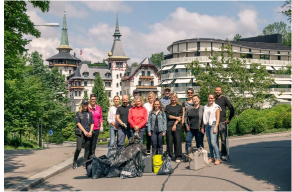
Forest Clean-Up-Days 2024

Im Rahmen des internationalen Earth Day am 22. April sowie ein weiteres Mal im September – am nationalen Clean-Up-Day – versammelte sich jeweils ein Team mit leeren Müllsäcken und Behältnissen bewaffnet zur «Ufruumete». Der umliegende Wald wurde strategisch durchkämmt und es wurden erschreckend viele Fremdkörper zwischen Bäumen, Sträuchern und sogar in der Erde gefunden. Doch neben den vollen Säcken nahmen wir vor allem eines mit: ein gestärktes Bewusstsein für unsere Umwelt und das gute Gefühl, aktiv etwas für den Schutz unserer einzigartigen Natur getan haben zu können. Wir freuen uns, dass diese Initiative mittlerweile nicht nur intern Anklang findet, sondern auch Menschen ausserhalb unseres Unternehmens inspiriert, sich für eine sauberere Umwelt einzusetzen.