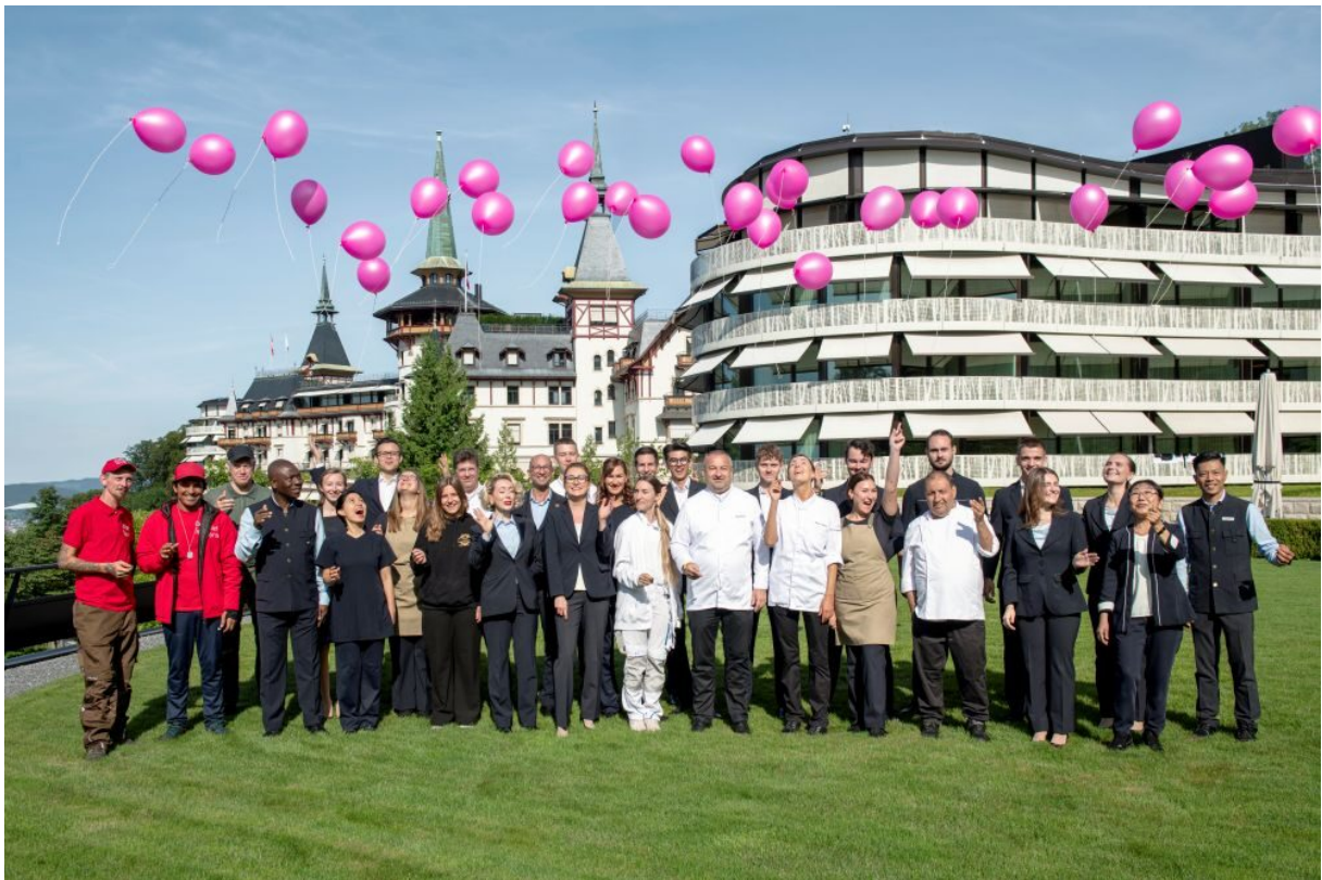
Die Auszeichnung «Top Employer» wurde vom Dolder Grand Team gefeiert.