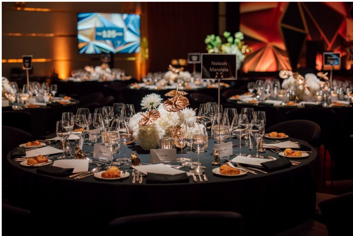
Jubiläumsfeier im Ballroom des Dolder Grand

Wer am 8. November 2024 die Hallen in unserem City Resort betrat, spürte unverkennbar: Es war der auserlesene Tag einer grossen Feier. Goldige Discokugeln, ein orangenfarbener Teppich und festliche Kleider, wohin man den Blick schweifen liess; an diesem Tag wurde das geschichtsträchtige Jubiläum mit viel Glitzer und Glamour gefeiert und damit ein weiteres Kapitel der Dolder Grand Geschichte geschrieben.