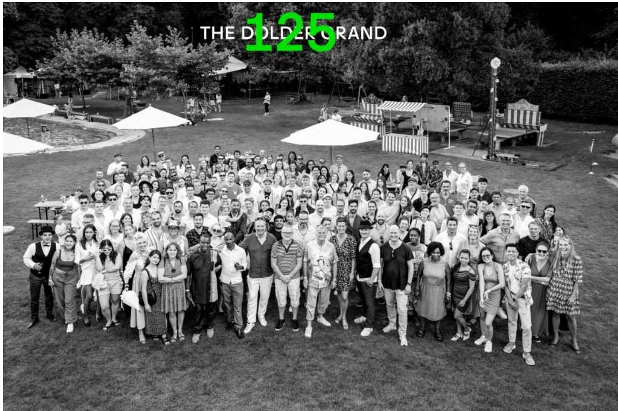
Sommerfest in den Dolder Sports

verteilt mit 385 Vollzeitmitarbeitenden, 53 Teilzeitmitarbeitenden und 155 ergänzenden Händepaaren im Stundenlohnpensum am selben Strang, um unvergessliche Jubiläumsmomente zu schaffen.