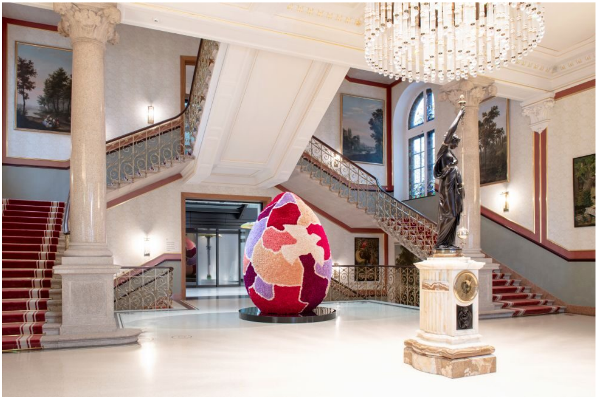
Osterei 2024 in der Steinhalle

Auch in den kalten Wintermonaten sorgte unser Floristik-Team für ein heimeliges Gefühl in der Steinhalle. Der prachtvoll geschmückte Weihnachtsbaum wurde zum strahlenden Mittelpunkt der Festtage – ein beliebtes Fotomotiv und eine stimmungsvolle Kulisse für unsere Gäste.