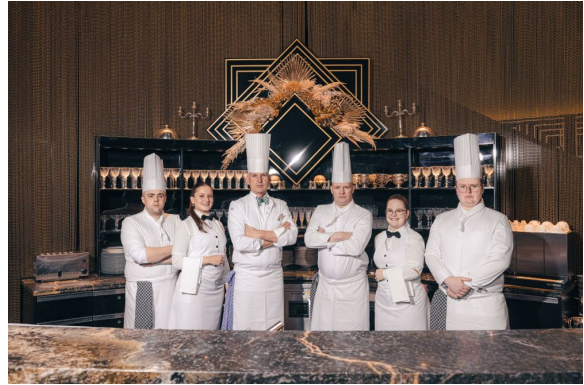
Restaurant-Team des «The Grand Heritage»