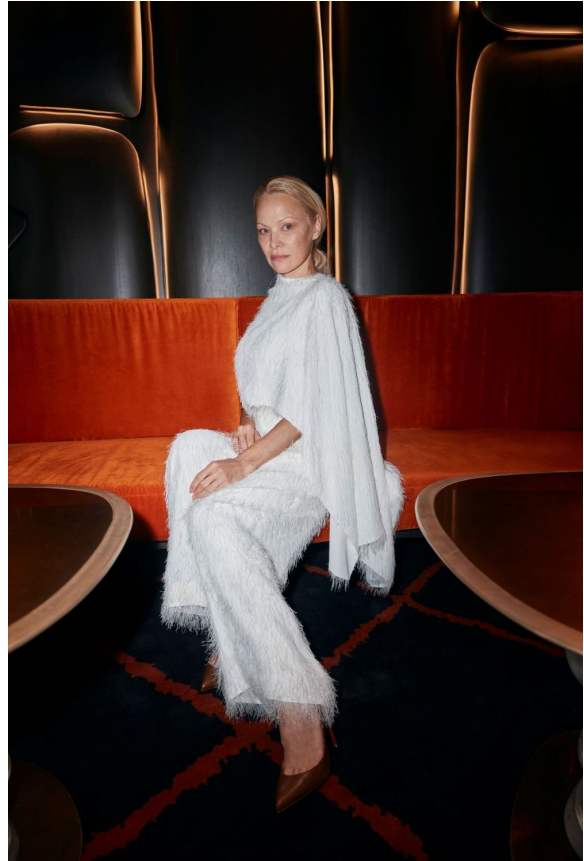
Staraufgebot im Dolder Grand: Pamela Anderson im Interview

Es erstaunt nicht, dass zu dessen Jubiläum auch bei den Besucherzahlen ein Rekord aufgestellt wurde. Insgesamt 140'000 Filmfans zog das Festival an und es bestieg somit hinsichtlich der Grösse den zweiten Platz im deutschsprachigen Raum. Bei zahlreichen der insgesamt 100 Filme traten Prominente auf den grünen Teppich. Darunter zu finden waren Filmgrößen wie Jude Law, Kate Winslet, Richard Gere und Pamela Anderson. Letztere zwei wählten unser City Resort als ihren Rückzugsort neben dem Rummel in der Innenstadt.