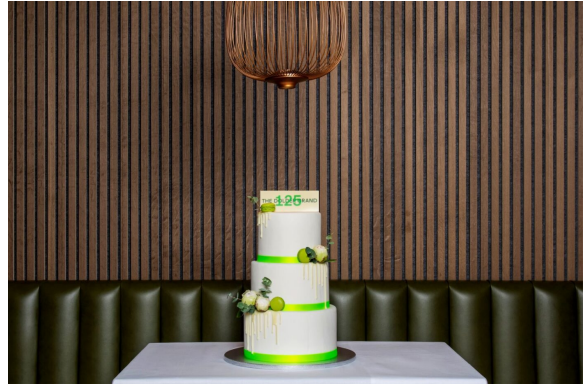
Geburtstagskuchen für das Dolder Grand

Genau am 10. Mai 2024 wurde das Dolder Grand 125 Jahre alt. Da haben wir es uns natürlich nicht entgehen lassen, mit der gesamten Belegschaft auf den historischen Tag anzustossen und das Dolder Grand hochleben zu lassen. Die hauseigene Patisserie hat zur Feier des Tages ebenfalls eine wunderschöne Torte kreiert – sie schmeckte fantastisch!