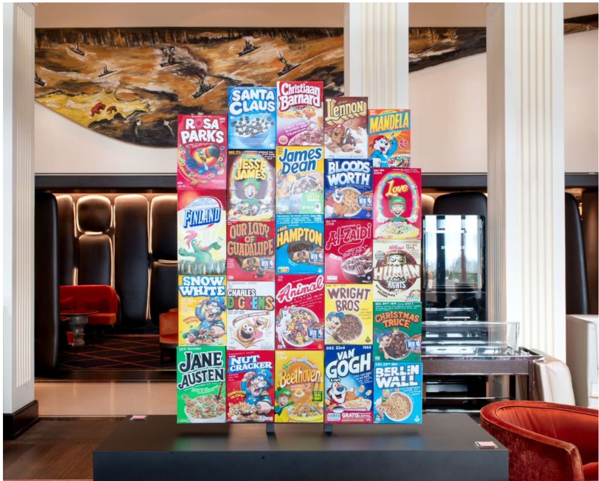
Adventskalender 2024 des finnischen Künstlers Jani Leinonen