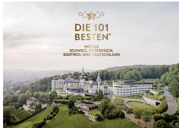
The Dolder Grand ist «Bestes Hotel der Schweiz»

Passend zum Jubiläumsjahr verliehen die «101 Besten» dem Dolder Grand den Titel «Bestes Hotel der Schweiz». Diese Auszeichnung ehrt das Gesamtpaket des City Resorts mit dem Versprechen, all seinen Gästen eine unvergessliche Auszeit mit höchstem Komfort, Spitzengastronomie und Erholung zu bieten. Der Gründer des Hotel-Rankings Carsten K. Rath: «Das Luxushotel jongliert spielend mit scheinbaren Gegensätzen: ruhmreiche Historie und spannende Zukunft, Schwelgen im Luxus und Bemühungen um Nachhaltigkeit, Schweizer Persönlichkeit und internationale Klientel.»